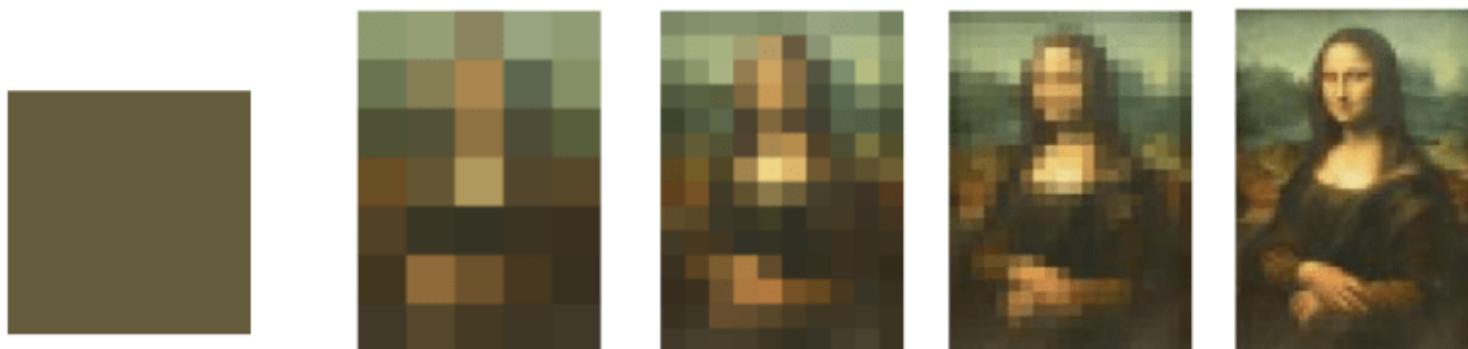
Cees van der Vleuten

De high stake-beoordeling volgt op een langere periode waarin heel veel feedback is verzameld vanuit verschillende contexten en verschillende feedbackgevers. Elk stukje feedback is als het ware een pixel waarmee uiteindelijk een scherpe foto ontstaat bij de high stake. Zoals Van de Vleuten et al. (2012) betogen is deze holistische manier van beoordelen een meer valide en betrouwbare manier van beoordelen. Zoals verwacht, was het inderdaad zo dat voor niemand de high stake-beoordeling een verrassing werd. Elke student wist al of het een voldoende of onvoldoende zou worden.